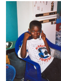
Criança no país de origem