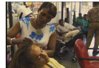
Pais no país de recepção