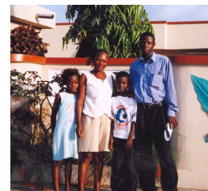
Cuidadores no país de origem